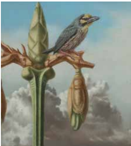
167 Diana van den Berg