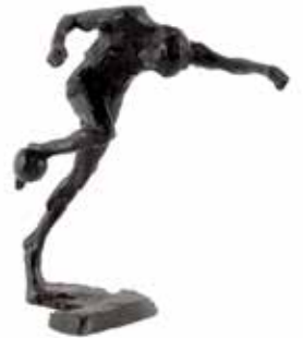
5179 Kees Verkade