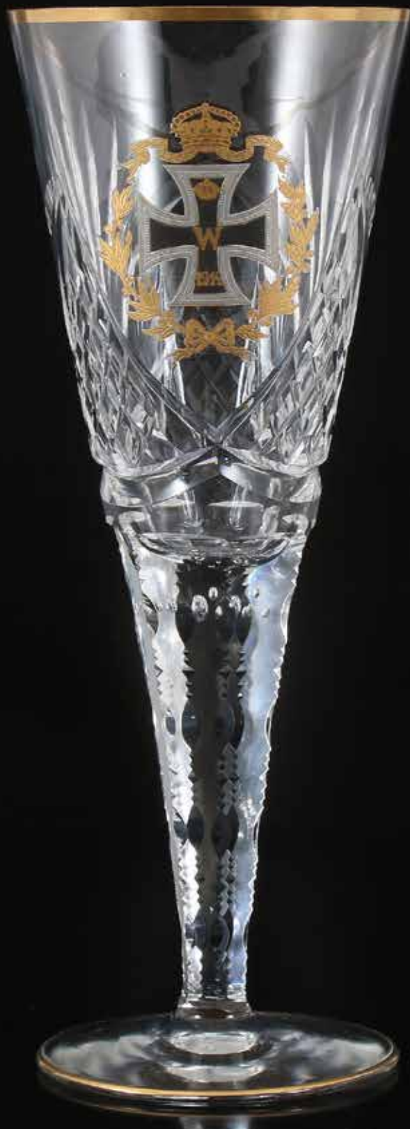
5217 Herinneringsglas / IJzeren Kruis