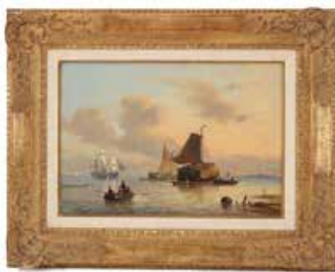
215 G W Opdenhoff