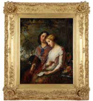
13 Gerardus Terlaak