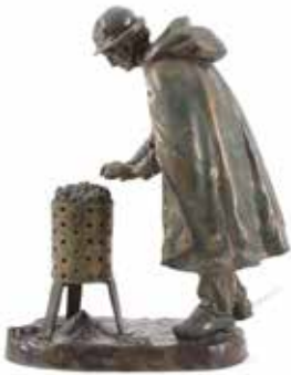
360 Zamak sierlamp