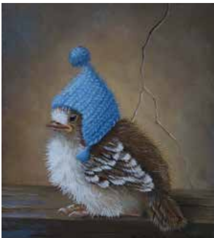
5119 Suzan Visser