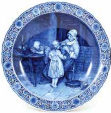
5014 Porceleyne Fles