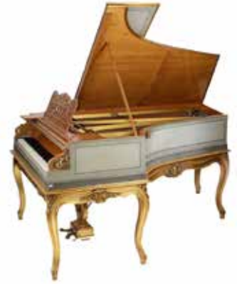
349 Pleyel vleugel