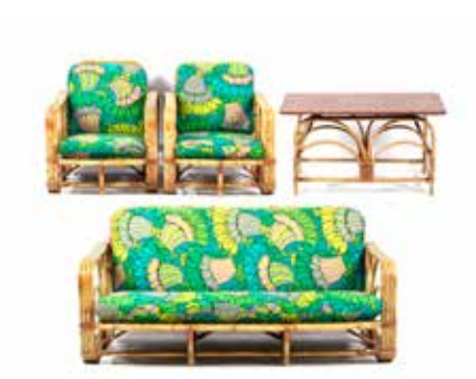
2091 Bankstel jaren 60