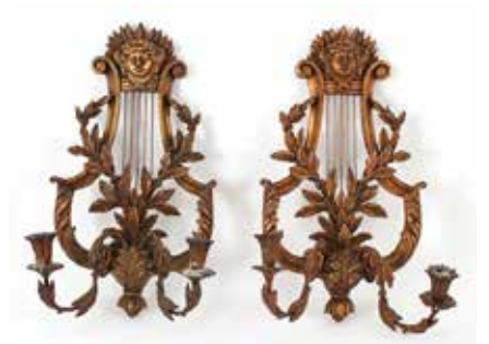
223 Wandluster 2x