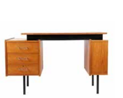
3000 Bureau jaren 60