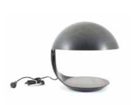
3067 Martinelli Luce