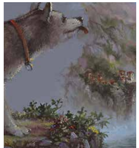
5122 Karel Sirag