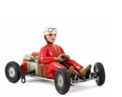
9305 Schuco 1055