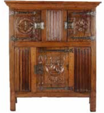
71 Antieke kast