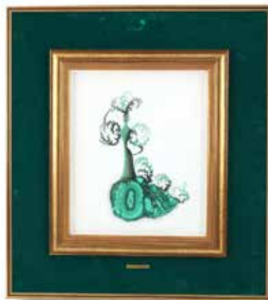
431 t/m 443 Cecile Dreesmann