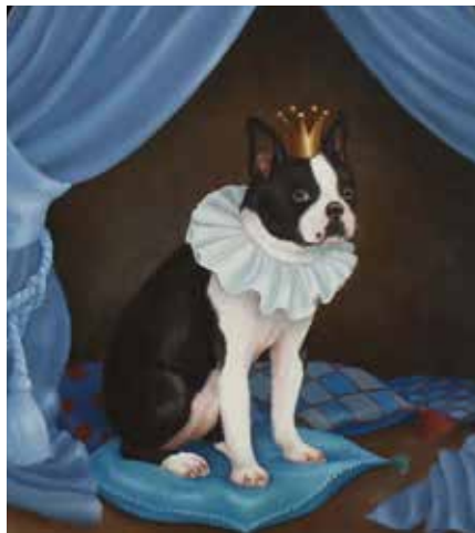
200 Suzan Visser