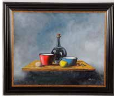
1033 Henk Poeder