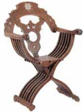
504 Perzische stoel