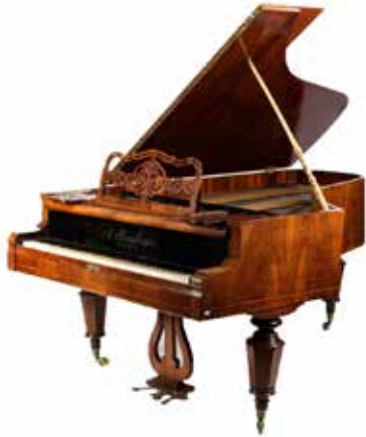
462 Promberger vleugel