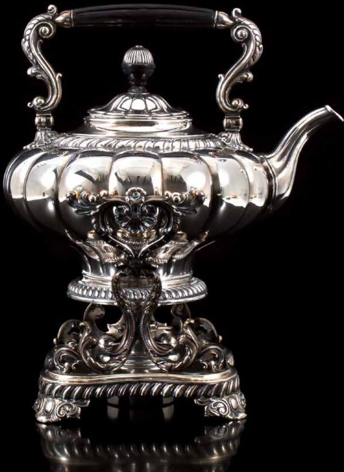
7083 Zilveren bouilloire, ca 1870