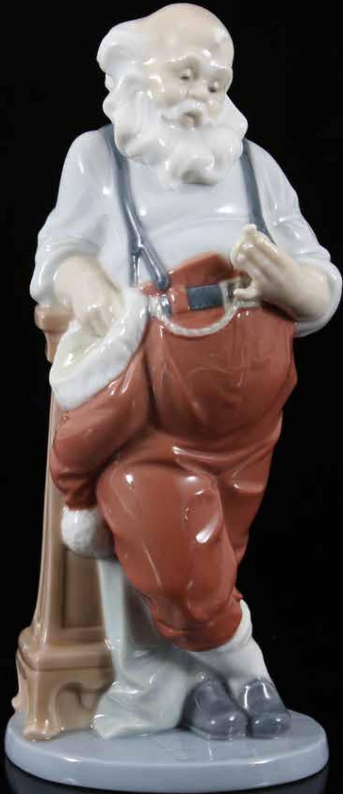
5048 Lladro Santa Claus