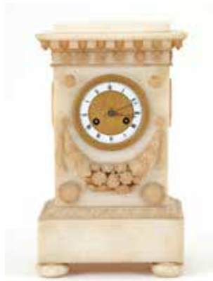
257 Marmer pendule