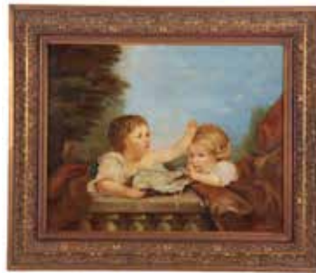
8 Monogram HR