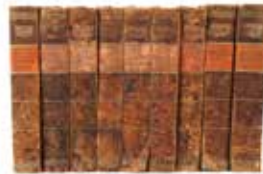
9299 Burg. Wetboek