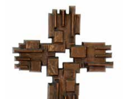
5194 Bronze object jaren 60