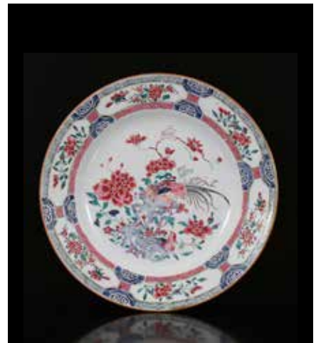
5277 Famile Rose