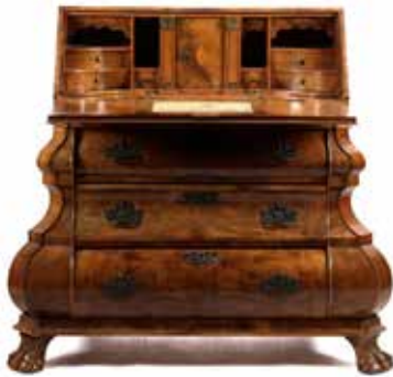
1038 Noten klepbureau