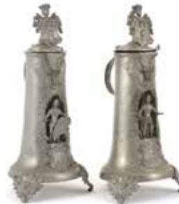
72 Gildekan 2x