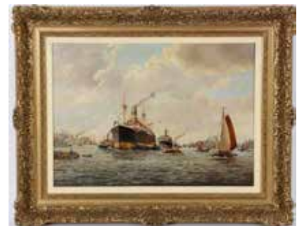
340 Onduidelijk gesigneerd