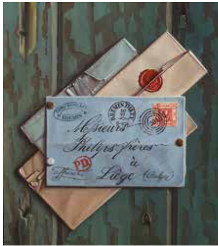
201 Piet Gutter