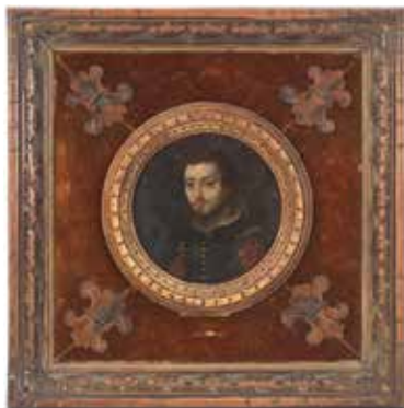
5097 Alonso Sanchez Coello