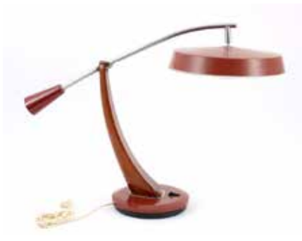
3068 President / Fase