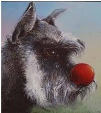
5124 Karel Sirag